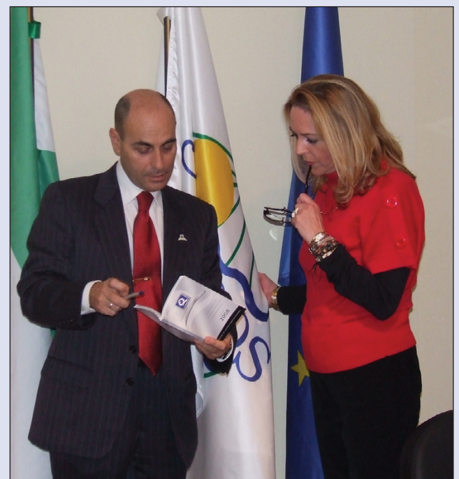
Miembros de la Delegación ICTE de Málaga

La Comunidad Autónoma de Andalucía cuenta con 318 establecimientos certificados con la Marca "Q" de Calidad Turística, siendo 150 Agencias de Viaje; 75 Hoteles y 39 Playas los sectores más representados.