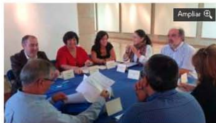
Integrantes de la Mesa de Calidad. // Fdv

La Mesa para la Calidad Turística del Concello de Sanxenxo dio el visto bueno ayer a la candidatura de seis firmas a adherirse al Sistema Integral de Calidad Turística en Destino (Sicted), al que ya pertenecen otras 91 empresas locales. "É unha satisfacción comprobar como ano tras ano seguimos sumando certificacións porque iso reflicte que os profesionais deste municipio teñen claro que a calidade é fundamental á hora de ser competitivos", afirmou la alcaldesa y presidenta de este comité reunido hoy en la Sala Nauta y en el que participó la concejala de Turismo, representantes de los grupos políticos municipales, del Patronato de Turismo Rías Baixas, de la Fegamp, de Entretendas, y del Consorcio de Empresarios Turísticos de Sanxenxo.