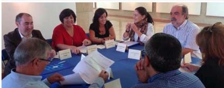
La alcaldesa de Sanxenxo presidió la reunión de ayer

La Mesa para la Calidad Turística del Concello de Sanxenxo dio el visto bueno ayer a la candidatura de seis firmas a adherirse al Sistema Integral de Calidad Turística en Destino (Sicted), al que ya pertenecen otras 91 empresas locales. "É unha satisfacción comprobar como ano tras ano seguimos sumando certificacións porque iso reflicte que os profesionais deste municipio teñen claro que a calidade é fundamental á hora de ser competitivos", afirmou la alcaldesa y presidenta de este comité.