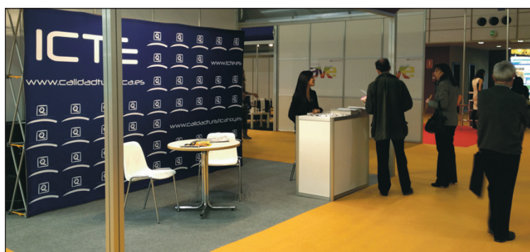
Stand del ICTE en la XV edición de INTUR.

El Instituto mantuvo diversas reuniones con profesionales del sector así como dio asistencia