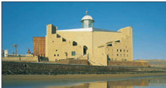
Servicios turísticos municipales.