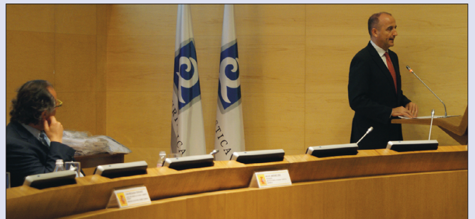
Miguel Sebastián en la IV Entrega oficial de Banderas 'Q'.

En el transcurso del acto el ministro expresó su satisfacción por "los niveles de implantación de la marca 'Q' que se han alcanzado en toda la geografía española con más de 2.200 establecimientos y servicios turísticos certificados con la bandera 'Q' de Calidad, de los que 176 son playas", destacando "la labor realizada por el Instituto para la Calidad Turística Española, garante y gestor de la marca 'Q', que centra toda su actividad en la difusión a lo largo del territorio nacional de los parámetros de calidad turística". Señalando además que "las cifras presentadas hoy por el presidente muestran el esfuerzo realizado, 176 playas con la bandera 'Q' de Calidad, localizadas en las costas de 92 ayuntamientos de nueve Comunidades autónomas diferentes. Son 24 playas más certificadas que el año pasado y 104 más, que en 2007. Es decir, en solo tres años, el número de playas certificadas ha crecido en un 144%".