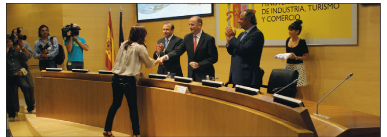
Entrega de Banderas 'Q'.

La Comunidad Andaluza vuelve a posicionarse en primer lugar con 59 playas certificadas, seguido de la Comunidad Valenciana con 47; Región de Murcia, 25; Cataluña, 24; con 7 están Asturias y Galicia; Baleares cuenta con 3 y Cantabria y Ceuta dos cada una. Canarias y País Vasco, comunidades muy implicadas en la certificación de sus servicios turísticos, sin embargo no cuentan con playas certificadas, aunque sí en proceso.