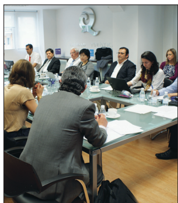
Reunión de los Grupos ISO en la sede del ICTE.

Más de 25 países, entre ellos Alemania, Francia, Italia, Reino Unido y España, se encuentran trabajando en la elaboración y al-