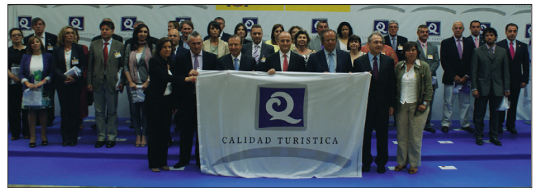
Foto Familia VI Entrega Oficial Banderas 'Q'.

Instalaciones náutico-deportivas En este mismo acto recibieron su galardón las instalaciones náutico-deportivas, que han conseguido certificarse bajo la norma UNE 188004, siendo dos clubes los que