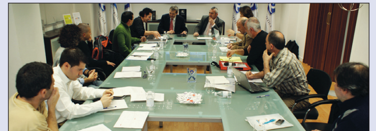
Asamblea general celebrada en el ICTE.

presente y el futuro, del Turismo Rural en nuestro país, bajo una misma premisa, la calidad como eje transversal de todas las políticas de ejecución en este y en todos los sectores del turismo nacional.