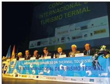
Inauguración Oficial del Congreso.

Durante toda la semana congresual, el presidente del ICTE