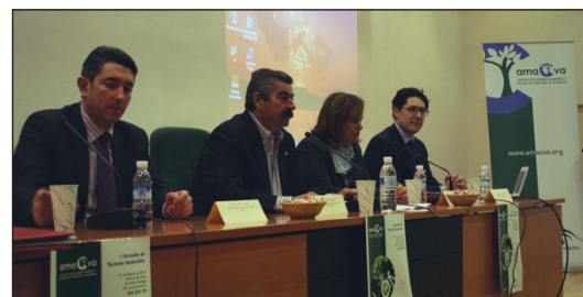
I Jornada Turismo Sostenible, en Vélez Málaga.