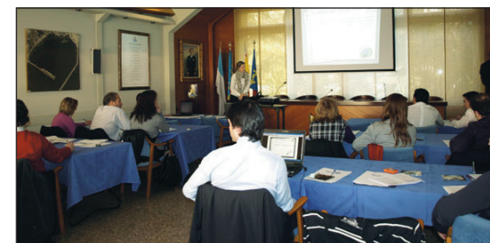
Asistentes al Curso de homologación de auditores.

Los pasados 15 y 16 de Marzo, tuvo lugar el primer curso de formación de auditores en la Norma UNE 188004:2009, en el Real Club Náutico de Torrevieja.