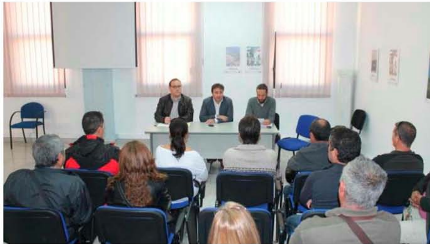
Reunión celebrada en el Ayuntamiento con propietarios de negocios estivales.

La nueva regulación evitará el inconveniente que suponía para sus propietarios tener que concursar cada año en la adjudicación de las actividades como hamacas, sombrillas o hidropedales.