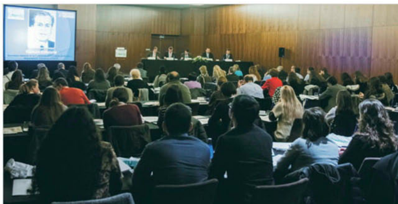
Futuralia se celebra en horario de mañana (de 10.00 a 13.00 horas) en el Hotel Eurostars Madrid Tower.

NEXOTUR.com / El Foro para la Sostenibilidad Medioambiental del Turismo en España celebra su séptima edición el 20 de noviembre en su sede, el Hotel Eurostars Madrid Tower. El evento dará a conocer algunos de los proyectos emprendidos por entidades u organizaciones del Sector, además de analizar el nivel de compromiso del empresariado turístico con el desarrollo sostenible.