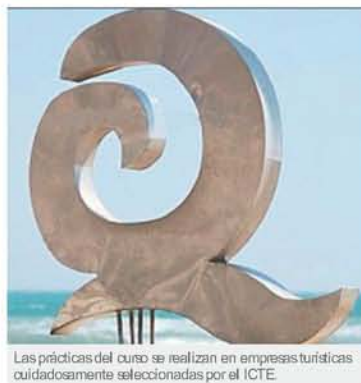
Las prácticas del curso se realizan en empresas turísticas cuidadosamente seleccionadas por el ICTE.

Precio de la titulación es de 2.950 euros y la fecha de (sujeta al número de inscripciones) será el 6 de febrero de 2015. El curso tiene una duración de tres meses de clases presenciales, más uno de prácticas de consultoría y se llevará a cabo en la Fundación Universidad Rey Juan Carlos.