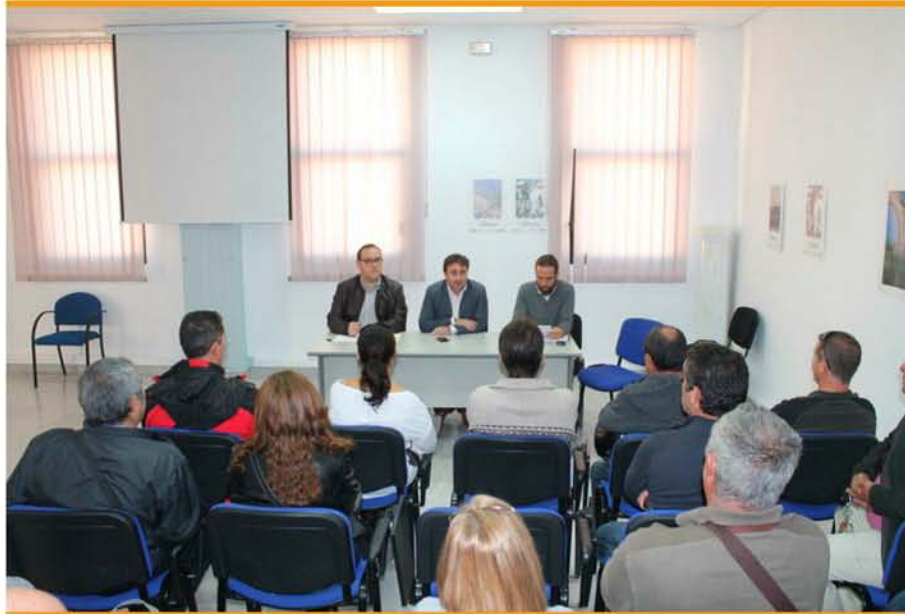
19/11/2014 | Salobreña