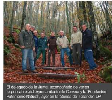
El delegado de la Junta, acompañado de varios responsables del Ayuntamiento de Cervera y la Fundación Patrimonio Natural, ayer en la "Senda de Tosande". DP

Entre las ventajas que ese certificado aporta a los visitantes de Fuentes Carrionas, está tener la garantía de calidad en los productos y servicios ofrecidos por el Espacio Natural Protegido y participar en la mejora de su gestión. Con ello, la Administración Regional consigue también aumentar la formación del personal y la mejora de la eficacia de las herramientas utilizadas.