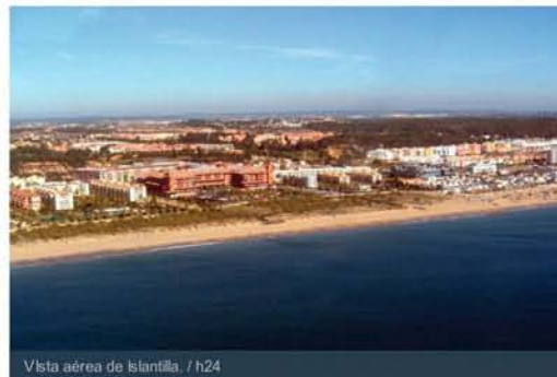
Vista aérea de Islantilla.

La Playa de Islantilla, gestionada en mancomunidad por los Ayuntamientos de Lepe e Isla Cristina, ha obtenido nuevamente la prestigiosa Bandera EcoPlayas, galardón que cada año otorga la Asociación Técnica para la Gestión de Residuos, Aseo Urbano y Medio Ambiente (ATREGUS) en reconocimiento a la calidad desde el punto de vista ambiental, de sostenibilidad, de excelencia en el diseño, de equipamiento y de su mantenimiento. Junto con Islantilla, en esta IX edición de estos premios han sido distinguidas del mismo modo la islaña Playa Central y la playa lepera de La Antilla.