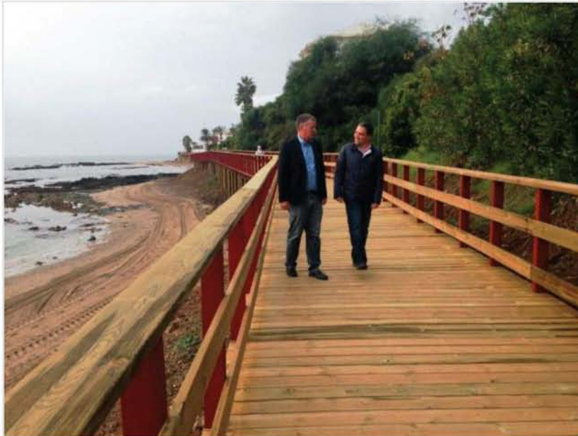
La Senda Litoral avanza con la conexión de Mijas y Marbella a través del primer tramo concluido

La Senda Litoral, el proyecto impulsado por la Diputación de Málaga en colaboración con el resto de administraciones para conectar los 180 kilómetros costeros de Málaga , tiene ya su primer tramo de 2,8 kilómetros concluido. Se trata desde el extremo de la Cala de Mijas hasta el Juncal, acercando las localidades de Mijas y Marbella a través de un camino de madera.