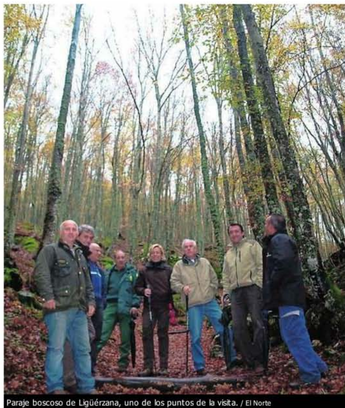
Paraje boscoso de Ligüérezana, uno de los puntos de la visita.

La visita se ha extendido por la Senda de Tosande, en el término municipal de Dehesa de Montejo, donde una