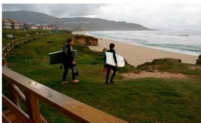
Souto Facal recordó la necesidad de extremar precauciones en días de alerta; en la imagen, Razo, ayer. CASAL