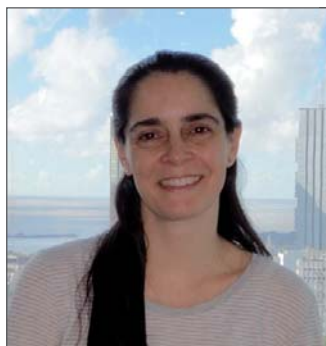
CLELIA MARÍA LÓPEZ

DIRECTOR GENERAL DEL ICTE (INSTITUTO PARA LA CALIDAD TURÍSTICA ESPAÑOLA)