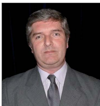
GONZALO A. CASANOVA FERRO

DIRECTOR NACIONAL DE GESTIÓN DE CALIDAD TURÍSTICA DEL MINISTERIO DE TURISMO DE ARGENTINA