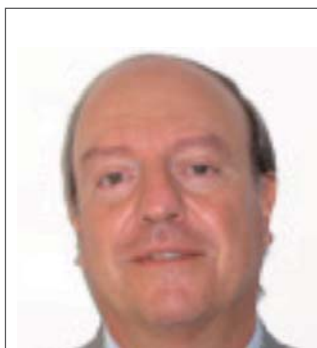
FRANCISCO JAVIER BLANCO HERRANZ

DIRECTOR NACIONAL DE GESTIÓN DE CALIDAD TURÍSTICA DEL MINISTERIO DE TURISMO DE ARGENTINA