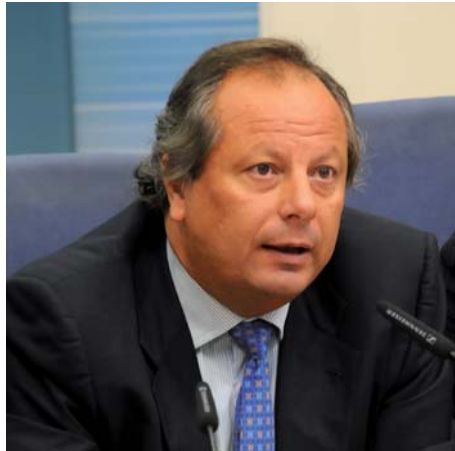
Miguel Mirones Díez Presidente del Instituto para la Calidad Turística Española

Como Presidente del Instituto para la Calidad Turística Española es un honor para mí poder presentaros en estas páginas el I Congreso Internacional de Calidad Turística que se celebrará en Santander durante estos días.