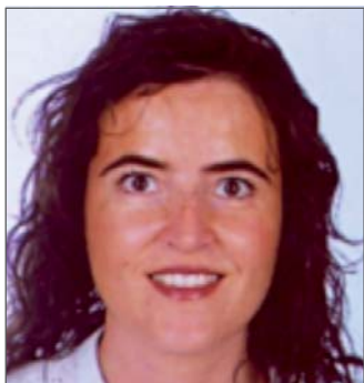
NATALIA ORTIZ DE ZÁRATE

MINISTRO DE COMERCIO INDUSTRIA Y TURISMO REPÚBLICA DE COLOMBIA