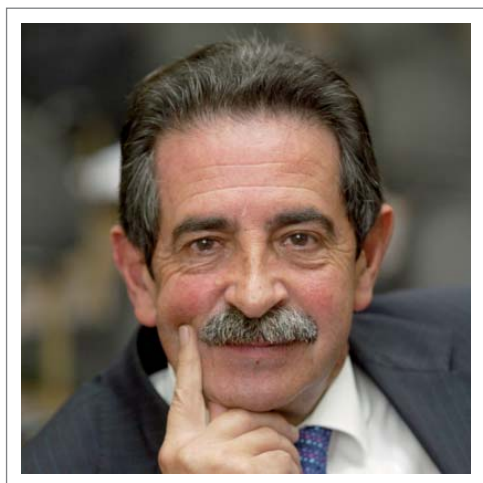
Miguel Ángel Revilla Roiz Presidente de Cantabria

La elección de Cantabria como sede del I Congreso Internacional de Calidad Turística es motivo de orgullo para todos los cántabros y una oportunidad para demostrar que no existe lugar mejor donde celebrar un encuentro de estas características, por el compromiso permanente de esta región con la excelencia turística.