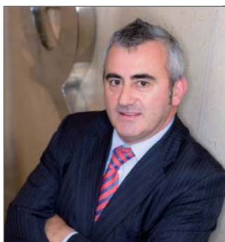
FERNANDO FRAILE GARCÍA

DIRECTOR GENERAL DEL ICTE (INSTITUTO PARA LA CALIDAD TURÍSTICA ESPAÑOLA)