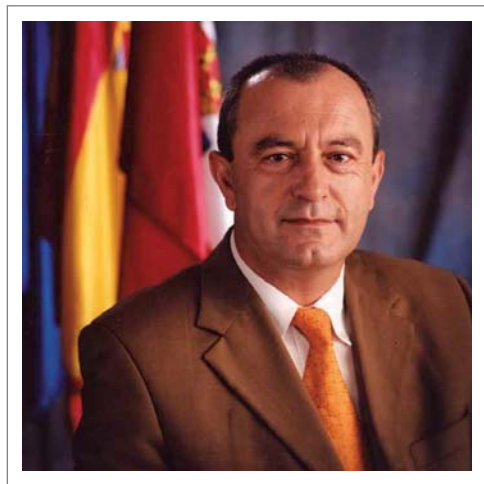
Francisco Javier López Marcano Consejero de Cultura, Turismo y Deporte

El turismo es sin duda un motor de desarrollo económico y social. Es un sector en constante evolución y que necesita encontrar y fomentar foros de encuentro y reflexión que reúna a las personas implicadas en un sector tan diverso. Por ello la celebración de este primer Congreso Internacional de Calidad Turística es sin duda una buena noticia y todo un acontecimiento para una región inquieta y llena de posibilidades como es Cantabria.